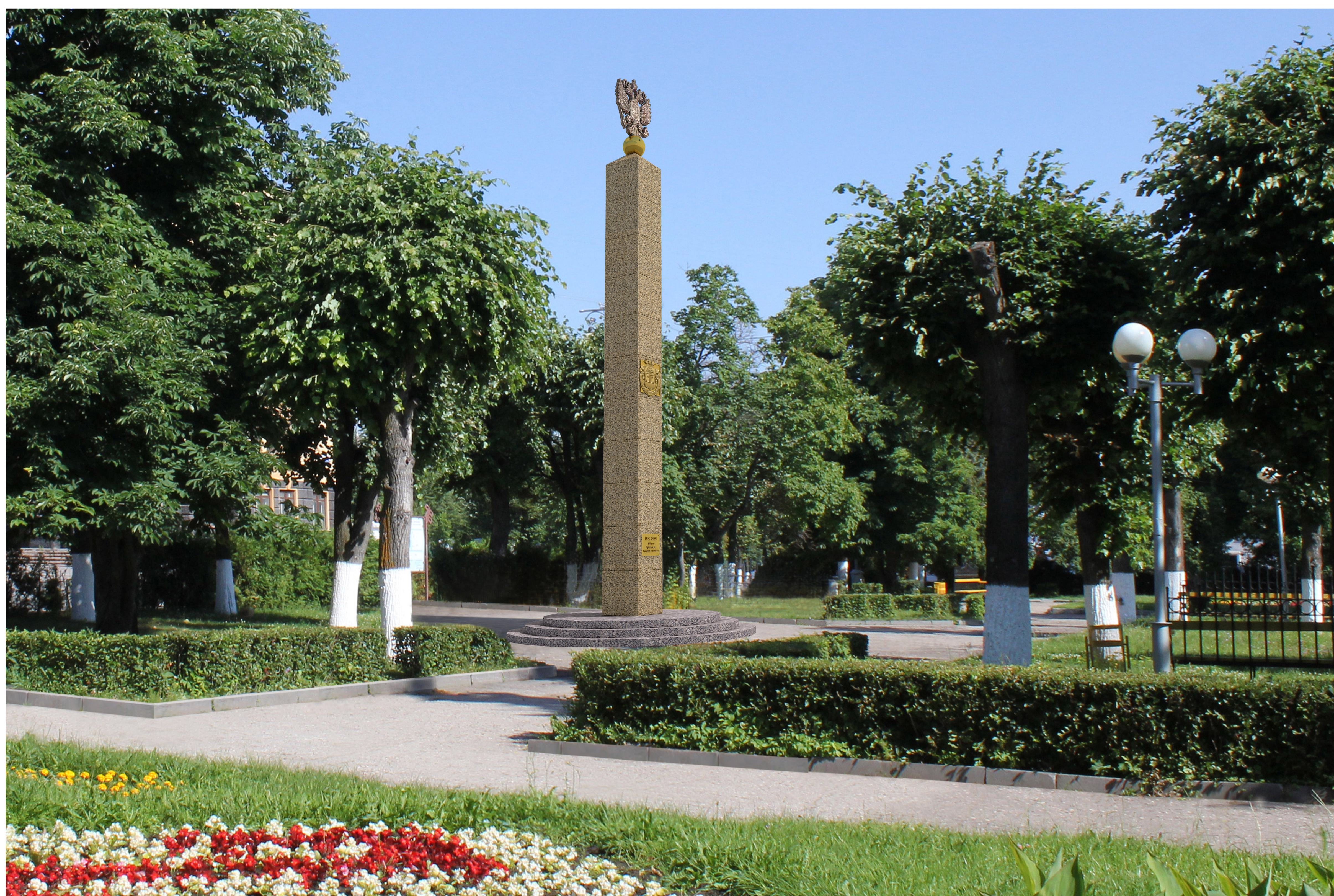
Привязка к местности, фотомонтаж