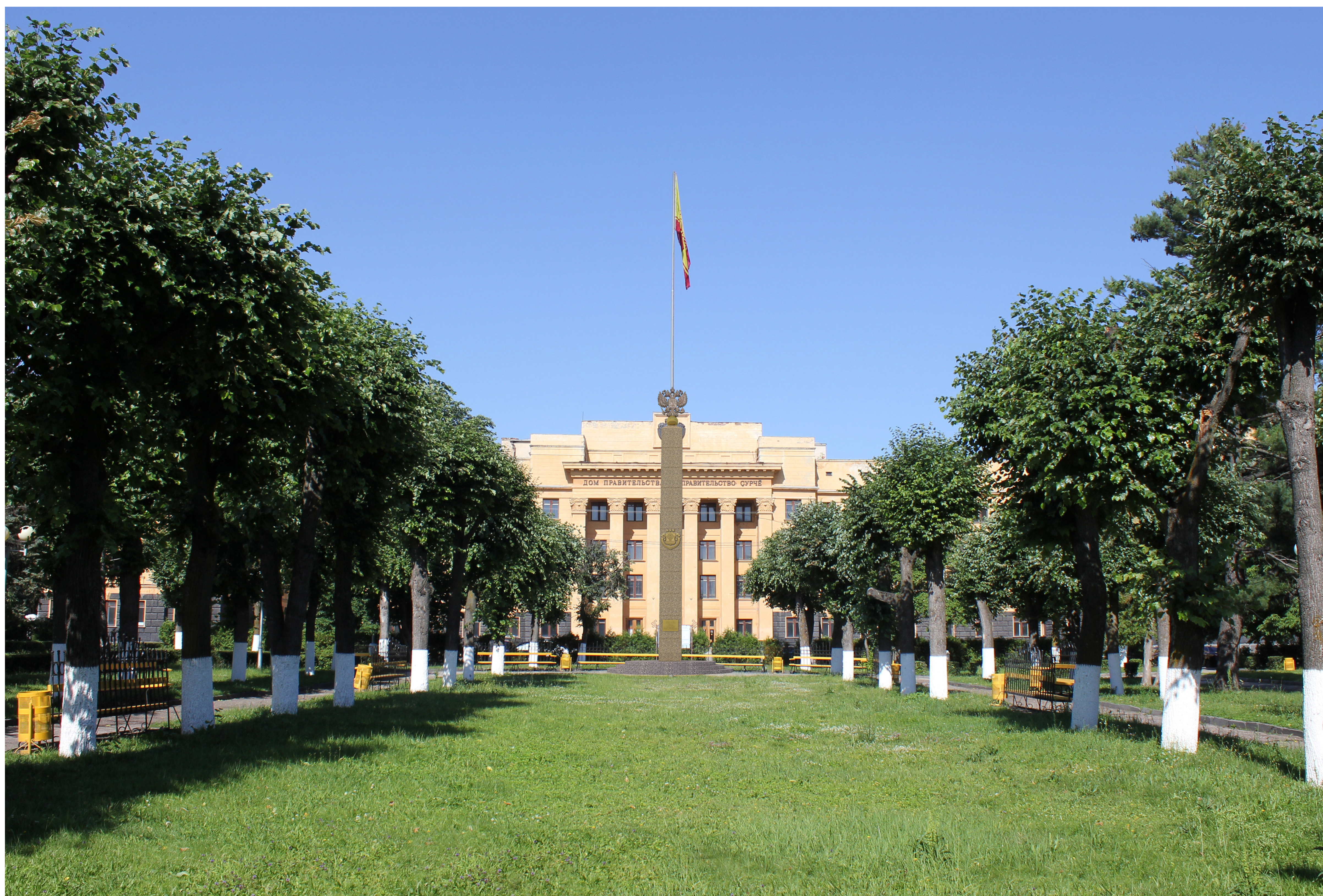
Привязка к местности, фотомонтаж