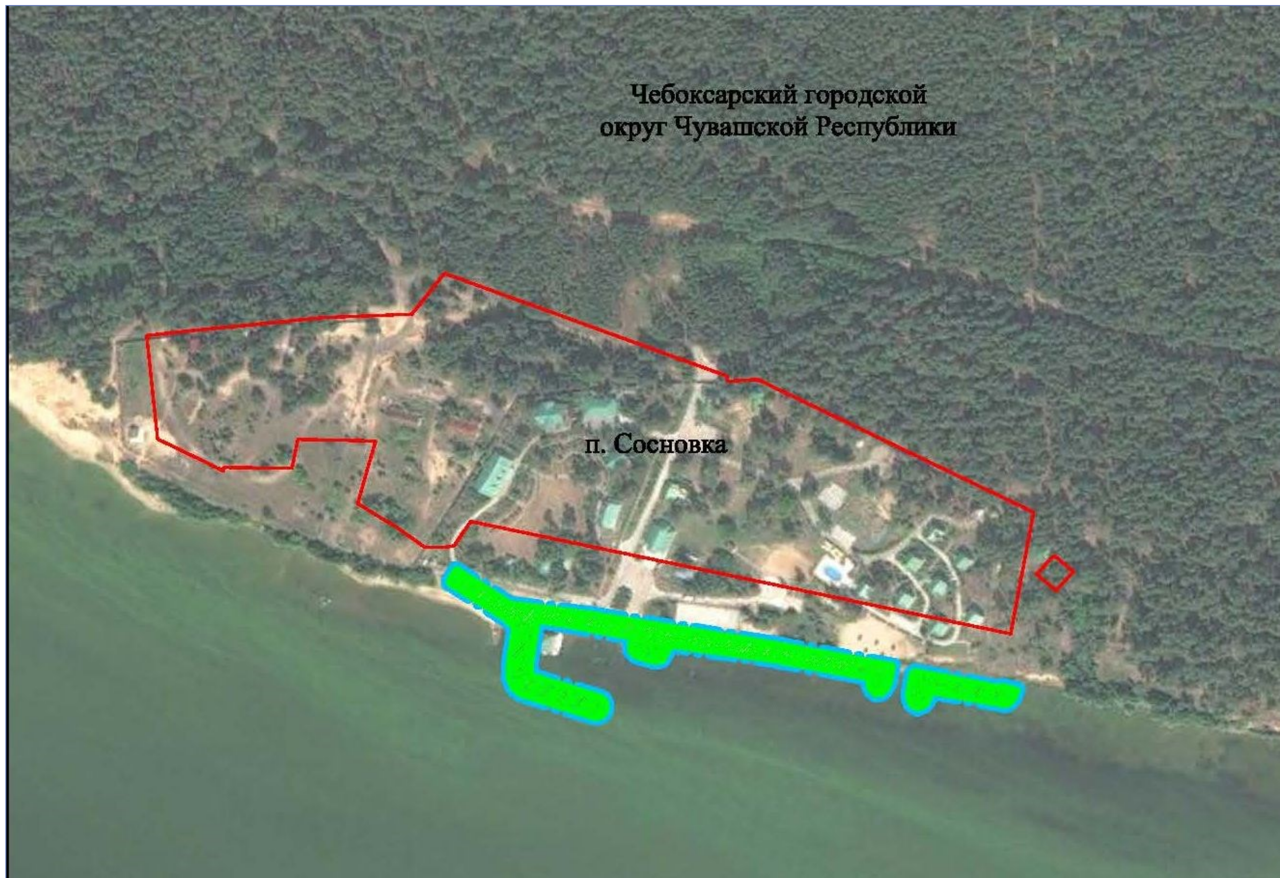
Схема расположения границ разработки документации по планировке территории