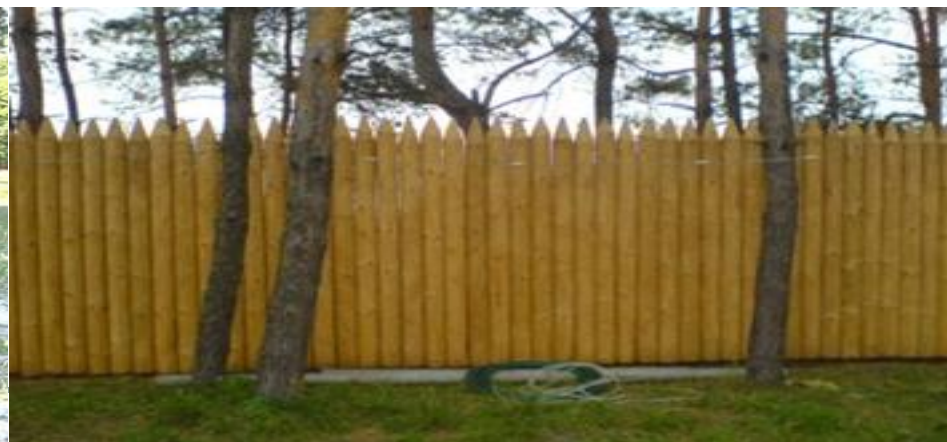
сплошные деревянные секции