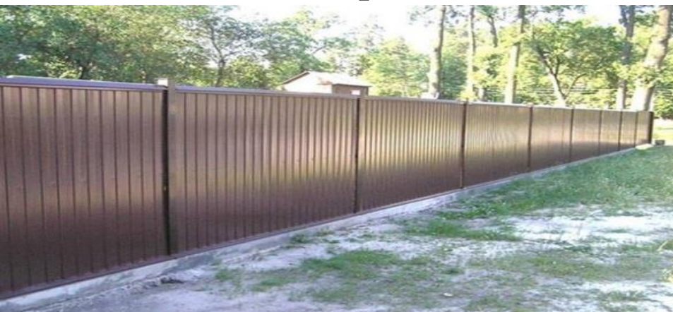
сплошные металлические листы