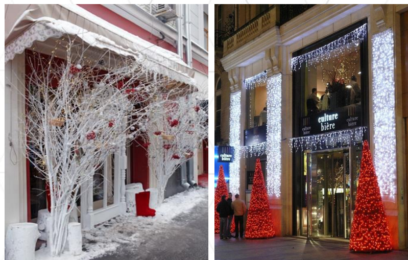
Арт.объекты и небольшие ели