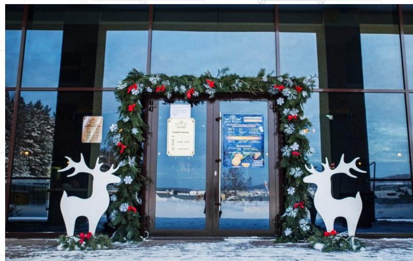
Объемные гирлянды - елочной ветви с игрушками