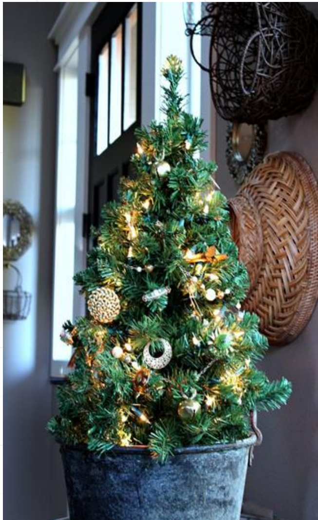
Ели малого формата