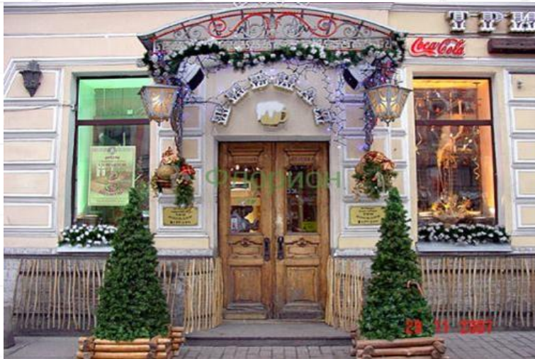
Объемные фигуры и небольшие ели