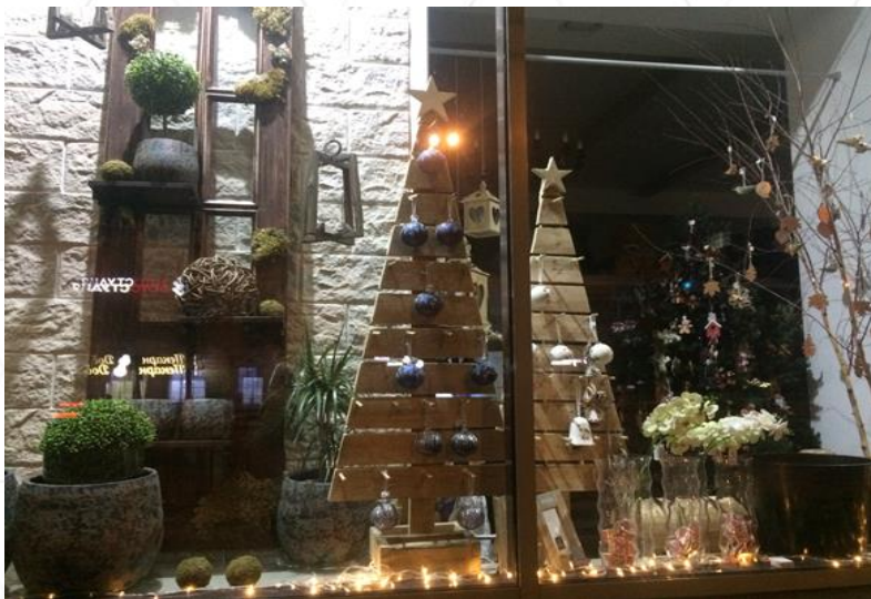
Магазин Фито-Лайн, пр.Ленина