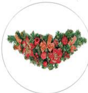
Использование елочных гирлянд для украшения входной зоны