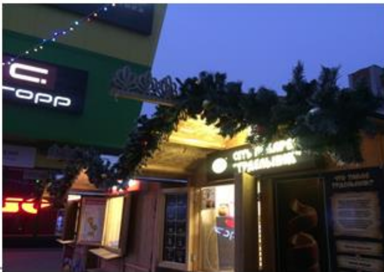
Киоски у ТЦ «Мадагаскар»