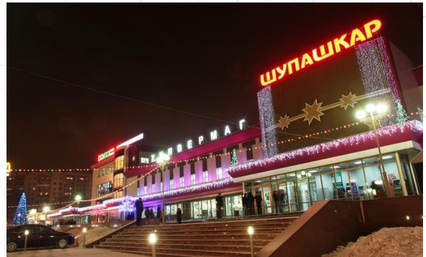
Торговый центр «Шупашкар»