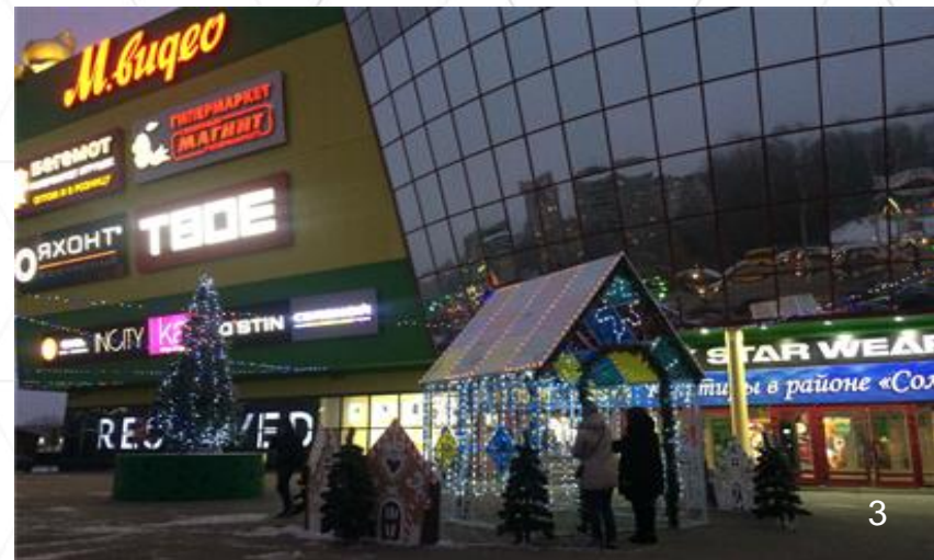
Торговый центр «Мадагаскар»