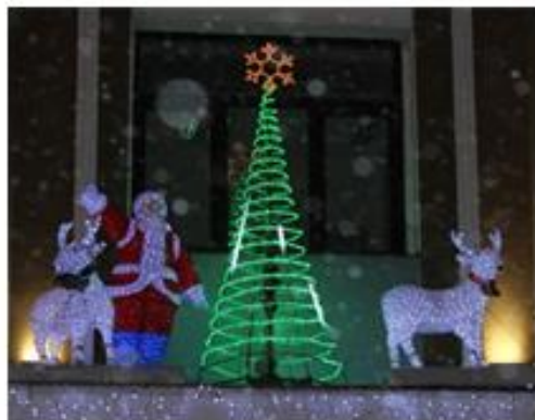
Размещение объемных фигур на козырьке