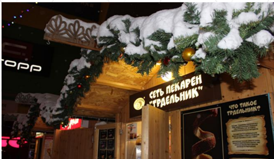
Нестационарные торговые объекты