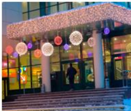
Размещение световых элементов под козырьком

Особое внимание следует уделить витринам, входным группам и карнизам.