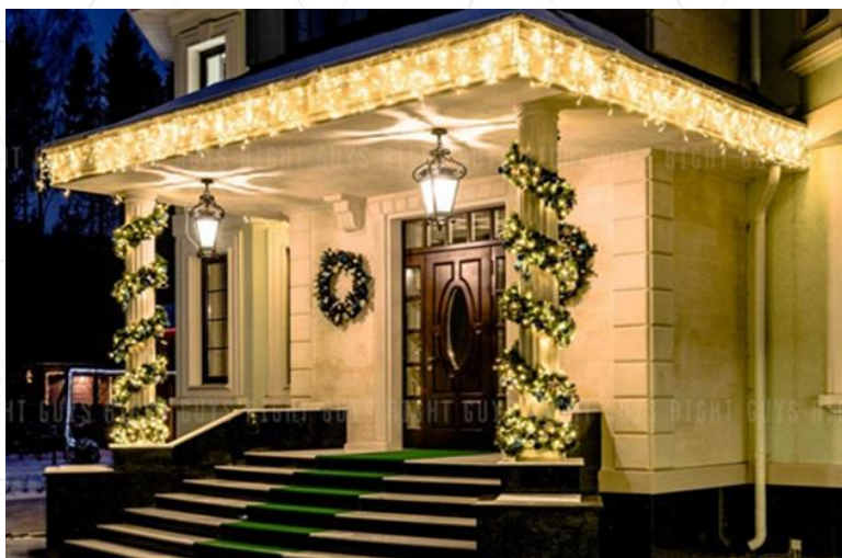
Световые дожди и бахрома на карнизах