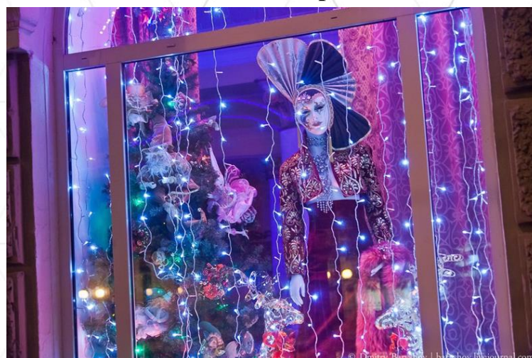
Ателье Дадиани, пр.Ленина