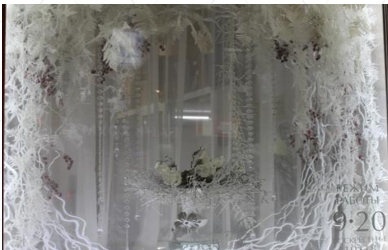
Цветочный магазин, ул.К.Маркса