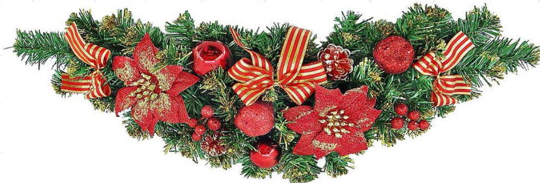
Гирлянды хвойные с игрушками