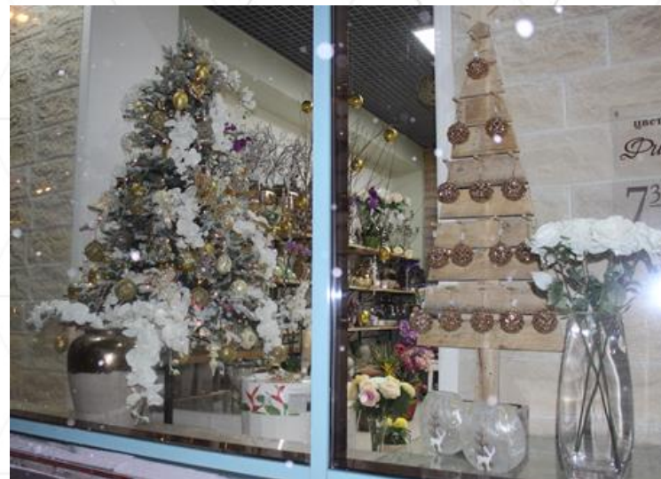
Магазин Фито-Лайн, пр.Ленина