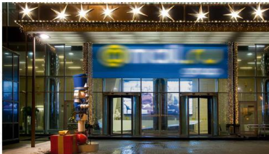
Оформление входных групп, прилегающих территорий