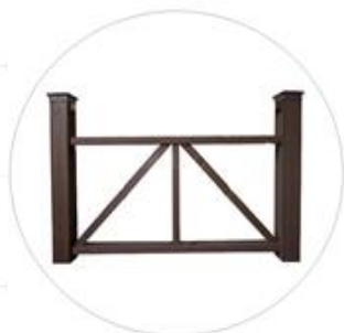
Тип ограждения деревянное