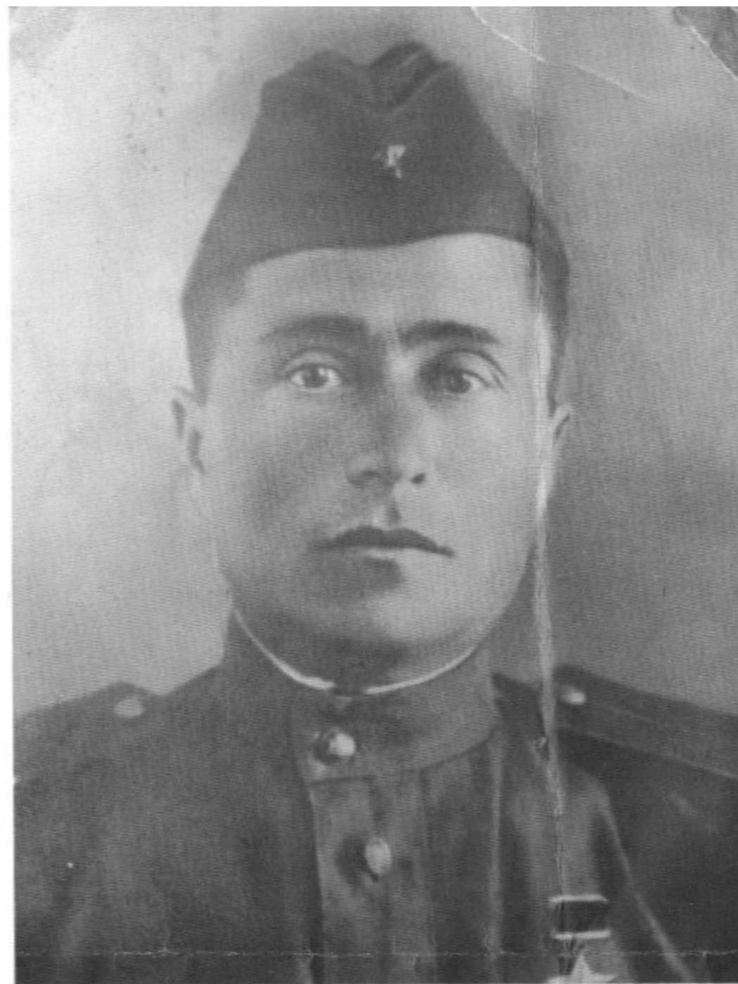
Памятник Герою Советского Союза Логинову Алексею Романовичу